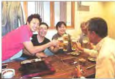
理事長を囲む懇親会には17名が参加