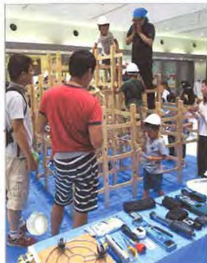
会場の一角にはインスペクションで使う道具類も展示