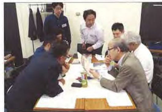
設計系のグループ