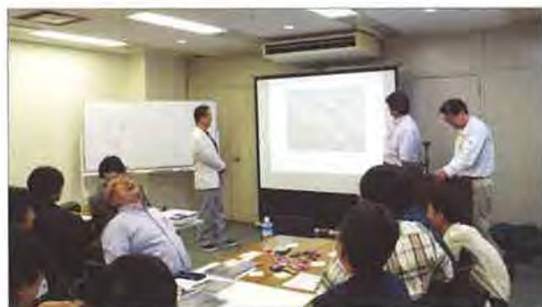
関東エリア部会では恒例のシミュレーション型ワークショップ

技術、不動産、設計など、参加者の属性ごとのグループにわかれ、インスペクション事例ごとにシミュレーションとディスカッションを行ないました。ワークショップ終了後は懇親会を開催し、会員同士の親睦を深めました。