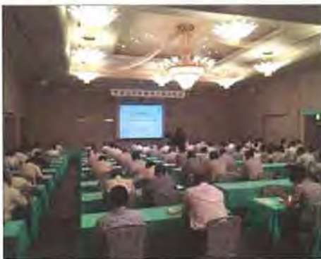
宅建業従事者でほぼ満席となった会場