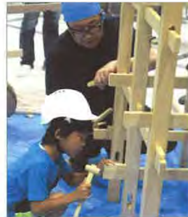
ホゾ穴にくさびを打ちこんで構造体(ジャングルジム)を固定