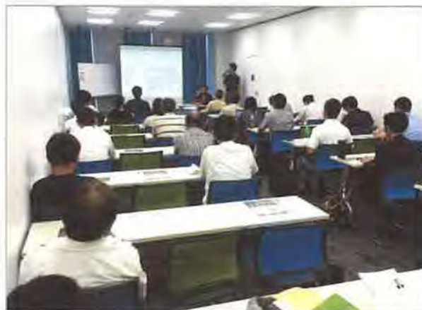
理事長セミナーは名古屋会場で4都市め