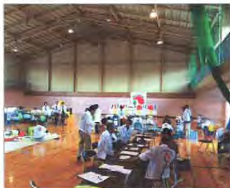
「第33回不動産フェア」会場の様子