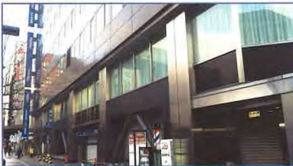
★ 札幌会場 TKP札幌ビジネスセンター | 受験者数 | 59名