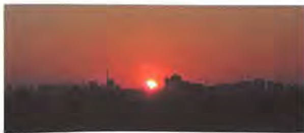
「もし応募がなかったら私が!」と用意していた一枚。自宅から撮った元旦の朝日。

エリア部会主催のセミナーや実地研修など、会員メルマガで案内は見ているけど行ったことない、興味はあるけど知っている人もいないし…という会員の方がおそらく大半ではないかと思います。でも、大丈夫。今号では各エリア部会長さんの一言コメントに顔写真を付けました。これでもう「知らない人」はいませんか？