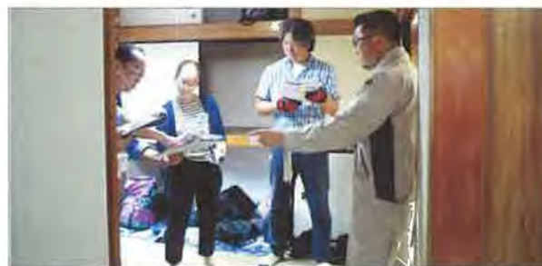
女性の会員も積極的に参加しています