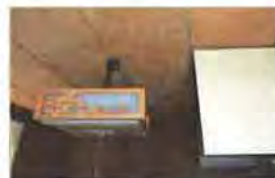
地震で瓦が落ち、2階の雨漏りが1階天井まで浸透