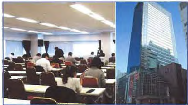
★ 仙台会場 TKPガーデンシティ仙台 | 受験者数 | 95名