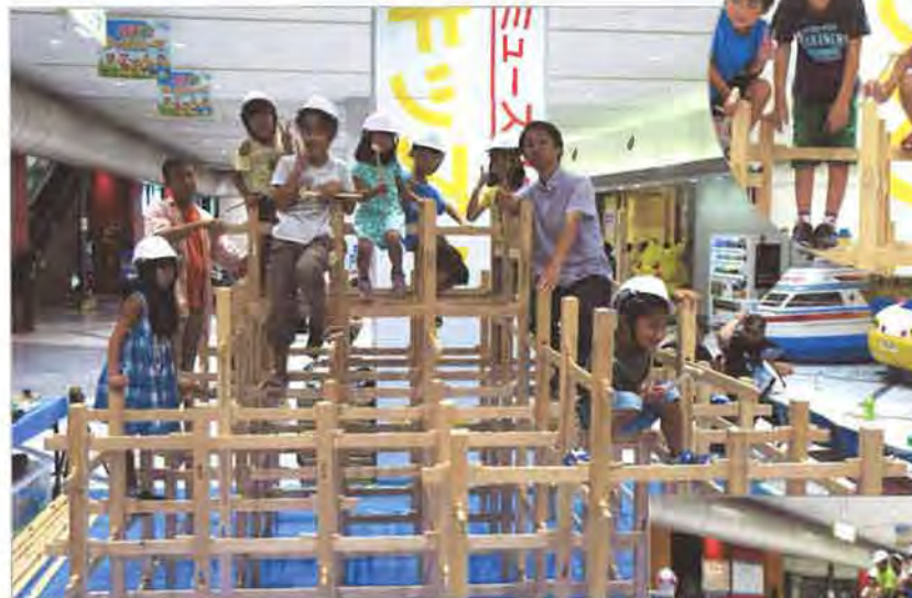
見事に完成したジャングルジムに乗って記念撮影でフィナーレ