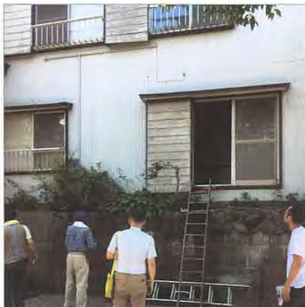
築約40年の木造賃貸住宅を使つての実地研修会

関東エリア部会員が所有する賃貸住宅で実地研修会を行ないました。それぞれの実務に活かせる貴重な意見交換の場となりました。終了後は、互いの情報を共有しながら会員同士の親睦を深め合う懇親会で盛り上がりました。