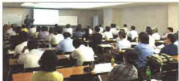
参加者からは、仲介業務に照らし合わせたもの、空家問題に絡めた質問が出ました