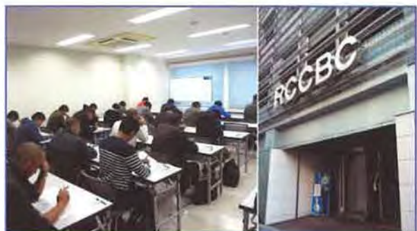
★ 広島会場 RCC文化センター | 受験者数 | 56名