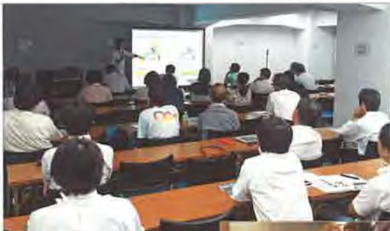
東京は八重洲と渋谷の2会場で理事長セミナーを開催