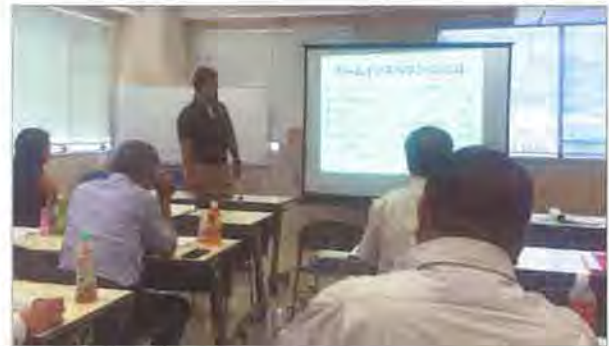
参加者からは「とても勉強になった」「もっと詳しく聴きたい」との感想をいただきました

鹿児島市内の不動産業者19社で組織する任意団体(木曜会)でセミナーを行ないました。ホームインスペクションの概要、そのほかの住宅瑕疵保険検査や耐震診断との違い、宅建業法改正後の展望について、約2時間にわたって解説。インスペクション中に撮影した瑕疵部分の写真を事例に、どのような対応が望ましいのかなどを考えてもらい、ホームインスペクションの重要性について理解を深めることに注力しました。