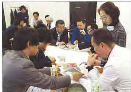
技術系のグループ