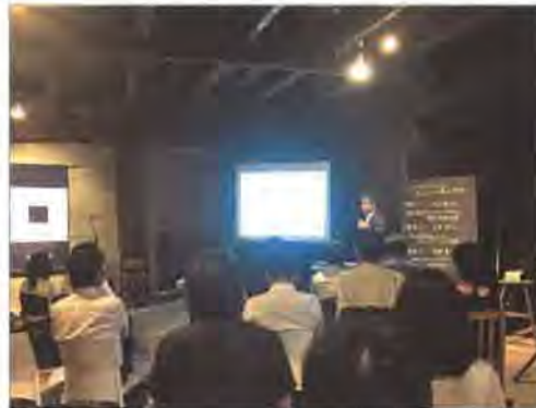
会場は、マーケットや芝居小屋などに使われる、明治期の木造倉庫をリノベーションした施設

リノベーション住宅推進協議会熊本支部主催イベントに参加し、「不動産流通におけるホームインスペクションの役割」と題して講演しました。宅建業改正の内容や、JSHIが考えるホームインスペクションと瑕疵保険申請時の検査との違いについて、聞き手の異業種従事者が正しく理解することによって、彼らの先に存在する一般消費者の啓発となればと考えています。参加者からは、熊本地震発生を受けて、耐震診断とホームインスペクションの違いを確認する質問を受けました。