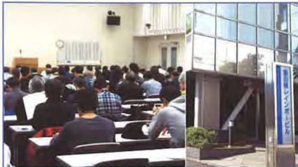
★ 東京会場 飯田橋レインボービル | 受験者数 | 137名