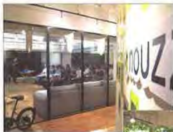
会場はJSHIも法人登録しているhouzz Japanのイベントスペース