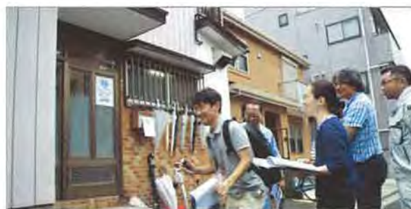
築38年の木造住宅を使った実地研修

築38年の賃貸住宅を使って、座学セミナーではなかなかわからない劣化の事象を、実際にじっくりと「見て」「触って」「理解する」ことを目的に開催。参加者を3つのチームにわけ、チームリーダー指導のもと、一日も早く現場デビューができるように、劣化状況の診断、検証、報告の仕方について、その都度、経験豊富な先輩会員のアドバイスを受けながら、現場の流れを体感してもらいました。最後には、依頼者から出そうな質問で「抜き打ちテスト」をしたり、内容の濃い研修となりました。