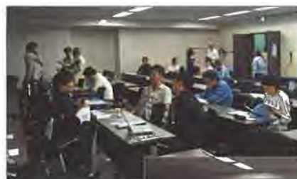
北海道から鹿児島まで約50名の会員が出席