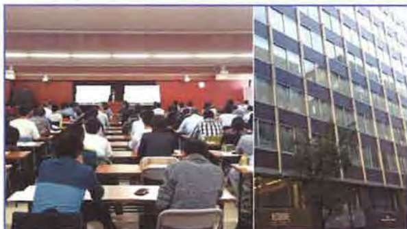
★ 東京会場 日本交通協会(新国際ビル) | 受験者数 | 114名