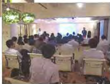
アットホームな会場の雰囲気の後押しされ、質疑も活発で盛会に