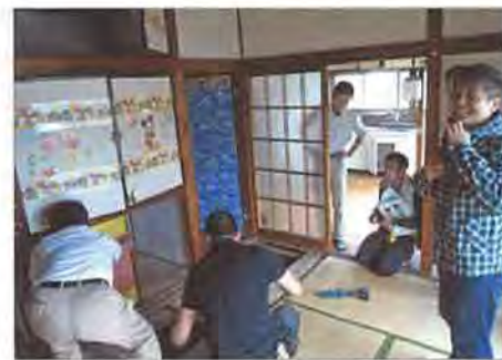
和室の畳と下地板を外し、他社報告でシロアリ蟻害判断とあった箇所の技術検証にトライした