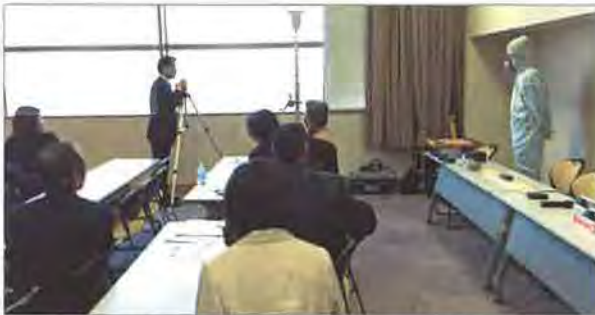
室内の床・壁レベル調査と、床下調査について、機材と床下検査の際に着る防護服を示しながら実演

不動産業者向けに不動産鑑定士が定期的に行なっているセミナーにおいて、今後の宅建業改正を見据えて、ホームインスペクションに関する講演依頼があり、3月に引き続いてセミナー講師を担当しました。前回までが全体的な説明だったので、今回は実務に寄せた内容に。住宅診断の場で使う道具類も説明しました。