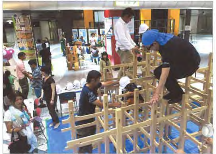
自分の手でものをづくり、みんなで完成させる喜びを体験する子どもたち

建築・インテリアに関する企業、団体が集まる展示会に出展。200名近い来場者数がありました。建築について楽しく学べる参加型アトラクション「木製ジャングルジム」に参加した子どもたちと一緒に制作し、好評を博しました。