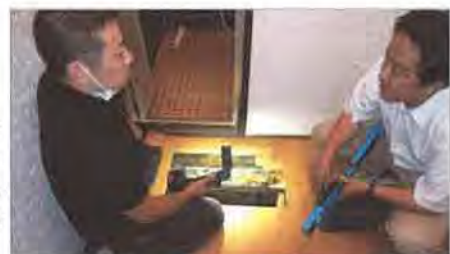
他社の報告書では原因はシロアリと判断された洗面所の床の劣化事象を検証中