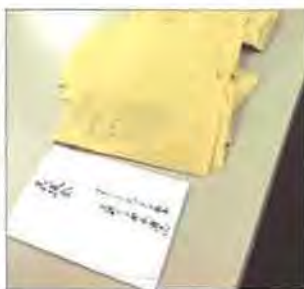
4月に発生した熊本地震被災者への義援金を募りました

赤外線サーモグラフィの正しい使い方、カメラが捉えた赤外線放射エネルギーの数値をどのように分析し、住宅診断に活かしているのかなど、実践的なセミナーとなりました。