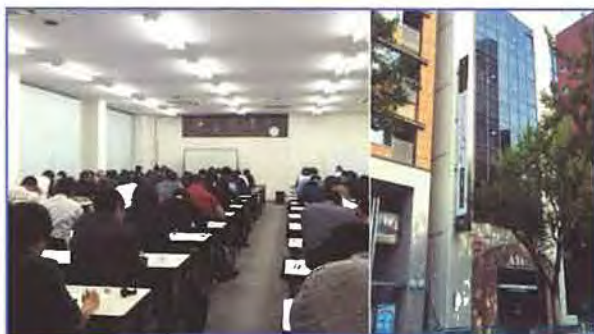
★ 福岡会場 カンファレンスASC | 受験者数 | 181名