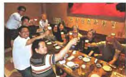
日頃の活動やホームインスペクションの未来を語りあった懇親会