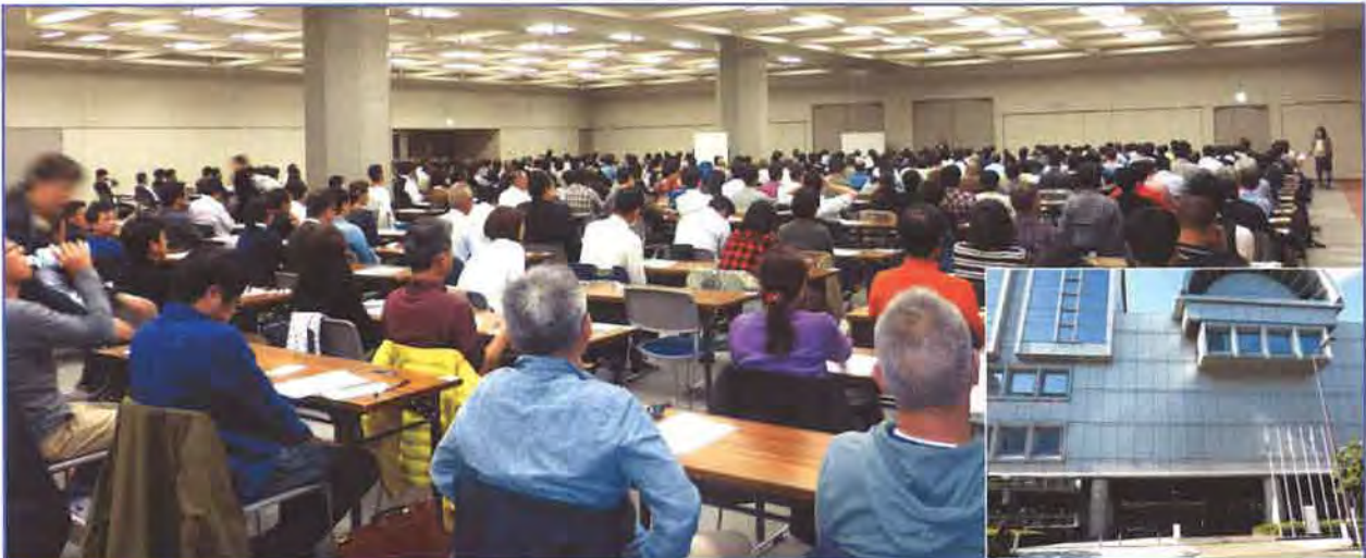
★ 大阪会場 マイドームおおさか | 受験者数 | 344名

今年は昨年に引き続き、全国7都市で開催、直前の急激な申し込み増もあり、過去最多の13会場での実施となりました。