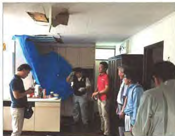
物件の劣化事象について参加者同士で意見交換