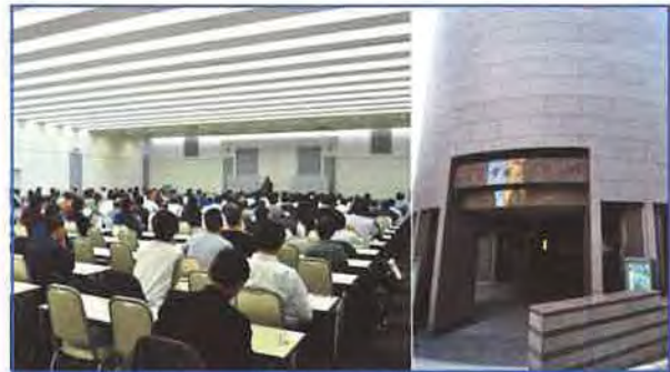
★ 東京会場 中央大学駿河台記念 | 受験者数 | 172名