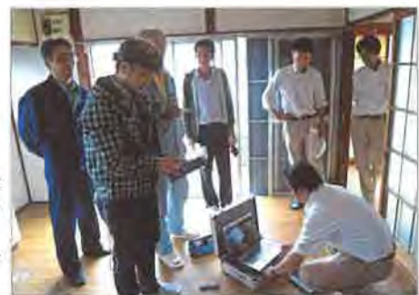
筋かい探知器を使って筋かいの位置を確認し、非破壊調査の有効性を検証

築40年の木造住宅を使って、仲介業者から提供を受けた他社の調査報告書を参考に、12名の参加者が実際に壁や床を破壊しながら技術検証を行ない、劣化報告判定の正誤などの「答え合わせ」ができた貴重な実地研修でした。