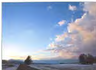
撮影地：羊蹄山へ向かう道を照らす朝日 (虻田郡倶知安町)

「新年」をテーマに募集しました「あなたが撮った写真が会報誌の表紙を飾ります」の第二弾です。