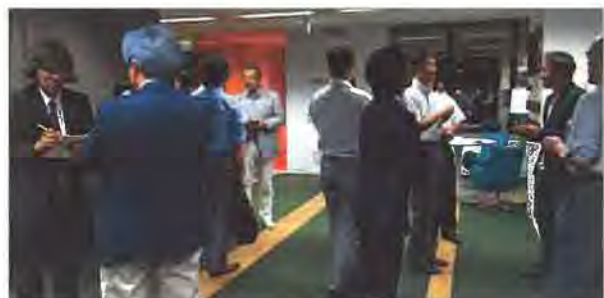
セミナー終了後、マスコミの取材を受ける長嶋修理事長ほか