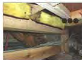
床下の断熱材の落下事象