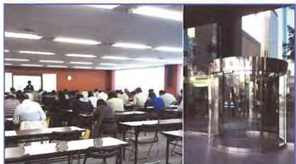
★ 名古屋会場 名古屋栄ビルディング | 受験者数 | 236名