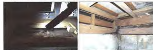
左：洗面所の床板を切り欠いて見えた部分。劣化原因は蟻害? 腐食? この判断が実は難しい 右：浴室側面の床下部分。土台が腐り、基礎の水染み跡を蟻道と見間違えやすい診断箇所