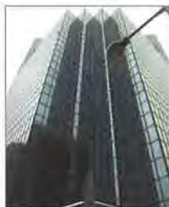
会場が入った建物外観

通常総会の前に、講演会も併催。住宅や不動産系の新聞・雑誌各社から事前に取材希望があり、セミナー終了後、登壇者を囲む姿がありました。