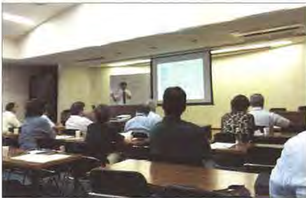
講師自身の不動産コンサル業務体験をまじえながらの解説

NPO法人熊本県不動産コンサルティング協会との共催で、ホームインスペクションセミナーを開催。ホームインスペクションの概要、現在の住宅流通市場におけるインスペクターの立ち位置、宅建業法改正を見据えた今後の展開について講演。JSHIの活動や、11月の認定試験についても言及して告知に努めました。