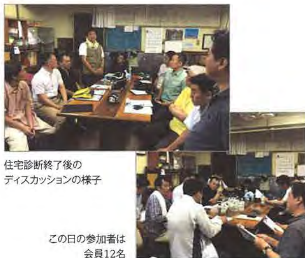
住宅診断終了後の ディスカッションの様子

関東エリア部会員が所有する賃貸住宅で実地研修会を行ないました。それぞれの実務に活かせる貴重な意見交換の場となりました。終了後は、互いの情報を共有しながら会員同士の親睦を深め合う懇親会で盛り上がりました。