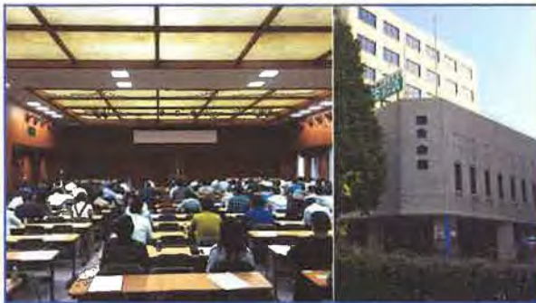
★ 東京会場 連合会館 | 受験者数 | 121名