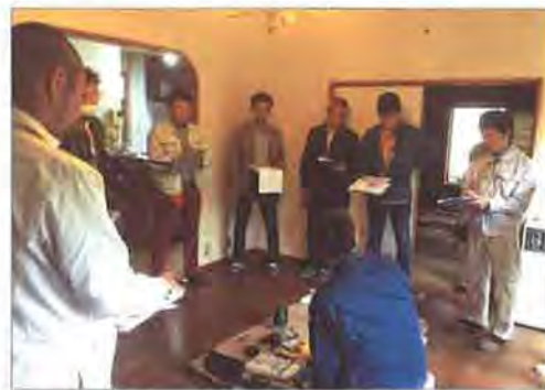
階の上と下にわかれて、効率よく診てまわりました

木造二階建ての中古住宅を使って、インスペクションで使う道具の解説、住宅診断の手順、チェックシートの確認ポイントなどを体験学習しました。最後に参加者それぞれがチェック項目ごとに気付いた点を発表し、情報共有しました。