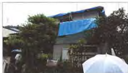
築36年、旧耐震前の木造住宅が会場

熊本地震で被災し、解体が決定している中古戸建住宅を借りての実地研修。地震による家屋の傾き→屋根瓦のずれ→雨漏り→腐れ・カビが発生するという、被災住宅で一般的にみられる状況が目に見えてわかる、今後の診断に役立つ研修となりました。講師が通常に行なっている診断手順に沿って進行し、参加者が質問したりその場で意見交換を行ないました。終了後は懇親会も開催しました。