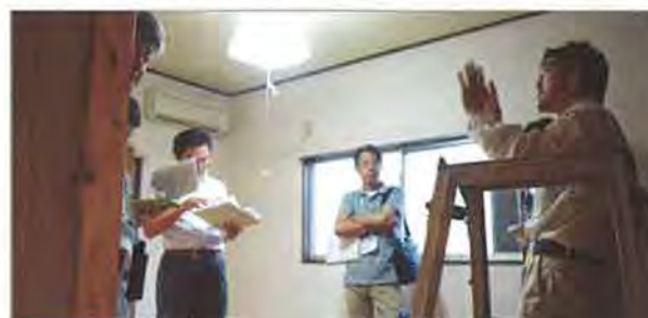
その場で疑問点が解消できるのも実地研修の利点のひとつ