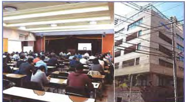
★ 東京会場 全国家電会館 | 受験者数 | 109名