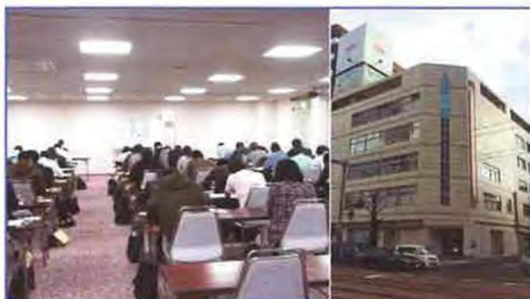
★ 広島会場 ワークピア広島 | 受験者数 | 41名