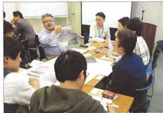
不動産系のグループ