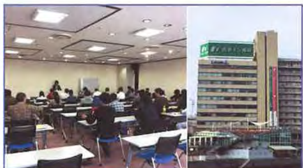
★ 福岡会場 西鉄イン福岡 | 受験者数 | 49名