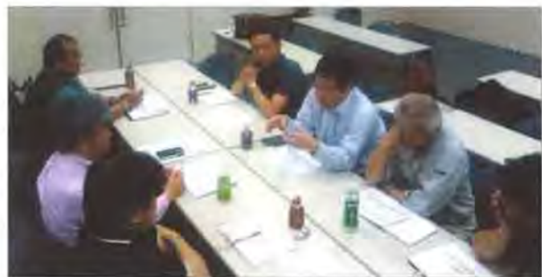
会議中の九州エリア部会有志役員

熊本地震で被災した会員の状況、JSHI理事会や近畿エリア部会からの義援金受領に関する報告など、有志役員で情報を共有しました。