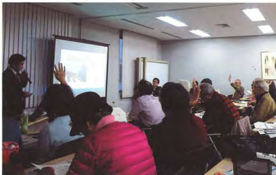
定員50名のところ60名の応募がありました クイズ形式で、楽しみながらホームインスペクションへの理解を深めてもらいました