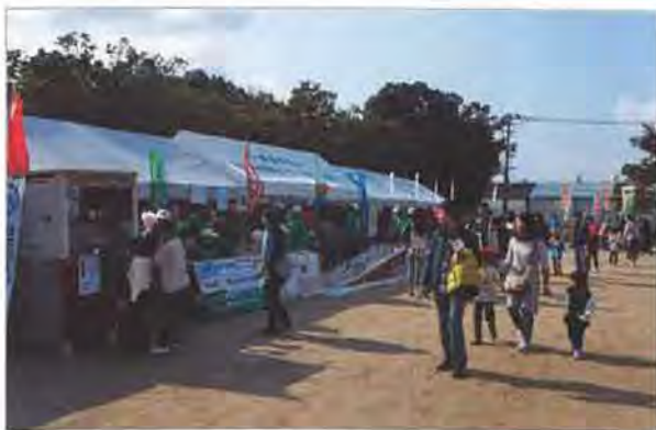
当日は好天にも恵まれ、地元の来場者で賑わいました