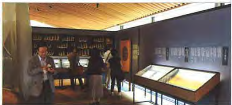
見学時は企画展「土のしらべー和の伝統を再構築する左官の技」を開催中