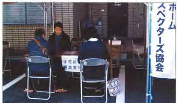
住宅診断相談コーナーには3組が来場しました