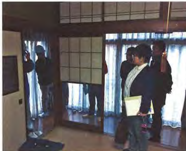
インスペクションの様子を模擬体験することで、宅建業者の住宅診断への理解を深めることができました