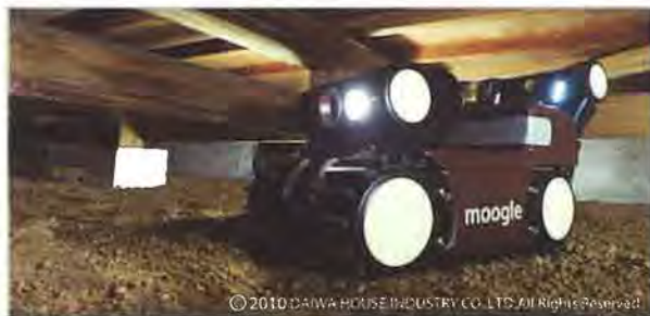
遠隔操作で床下をチェック

詳しい資料や導入企業様の事例DVD、実際の現場でのデモ走行など、下記までお気軽にお問い合わせ下さい。またwebサイトからでもお問い合わせいただけます。