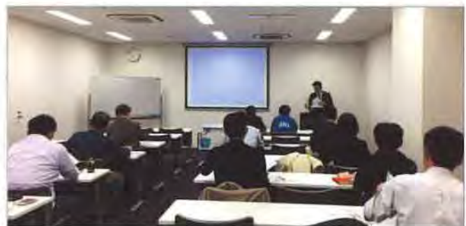
第1部の講師は外部団体より招へいしました