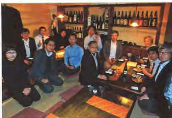
14名が参加した懇親会では、互いに熱い想いをぶつけあいました