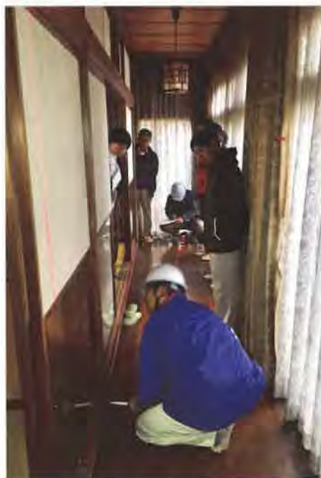
レーザーを使って床の傾斜を測定中

通常の業務ではホームインスペクション(住宅診断)に接することのない不動産関係者、主に宅建士を対象に、中古物件で実際にホームインスペクションを行いながら解説する実務的な見学会を実施しました。午前と午後に分けて県内2か所で同日開催し、合わせて23社が参加。講師は東北エリア部会の会員3名が務め、うち1名は場面ごとの道具の使い方を説明、ほかの2名はインスペクションを行いながら劣化状況の解説を加えました。見学会終了後、講師がまとめた診断報告書の簡易版を参加者に配布することで、現場で見聞きしたことがどのようにまとめられるのかを理解してもらうことができました。