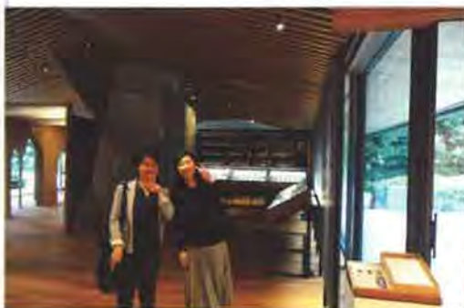
木の香りに包まれた館内。道具に触れたり、カンナくずの香りを嗅いだりできる体験型展示も

次にご紹介する近畿エリア部会では、定例会に先立ち、日本で唯一の大工道具のコレクションを有する竹中大工道具館の見学ツアーを企画するなど、7エリアのなかでも特に活動が盛んです。