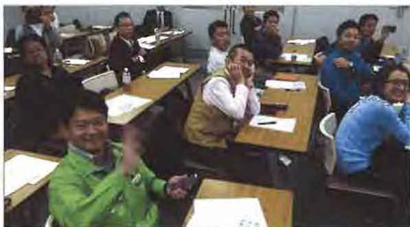
当日は35名が参加(講師が持参して試験飛行させたドローンから撮影)