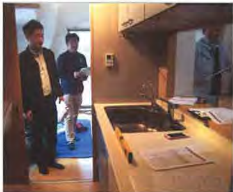
水平器でキッチンカウンターに傾きがあるかを測定中

築約15年の集合住宅の一室を会場に、約3時間にわたって実地研修を行いました。会員10名が参加しました。