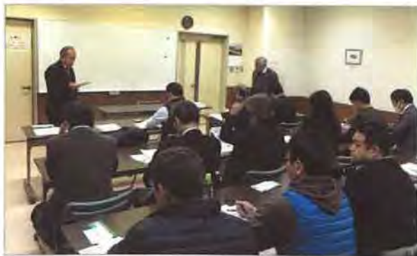
小さな支部にあつて、20名の参加者はインスペクションへの関心の高さの表われ