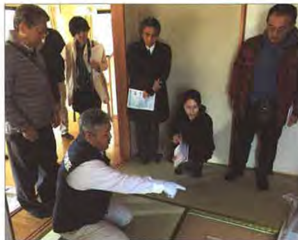
当日の様子は3月15日発行の『中国新聞』朝刊と、3月28日発行の旬刊『山口経済レポート』でも紹介されました