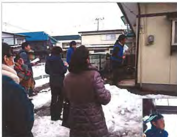
この日の盛岡市は日中の気温が5~6℃という寒さのなかでの開催

中古住宅で先に実地研修を行い、使う道具や診断のポイントを具体的に説明。続く座学でおさらいをして理解を深めました。実地研修には非会員の6名を含めて16名が参加、広域である東北では初となる岩手県内での研修会開催ながら、ホームインスペクションへの関心の高さがうかがえました。