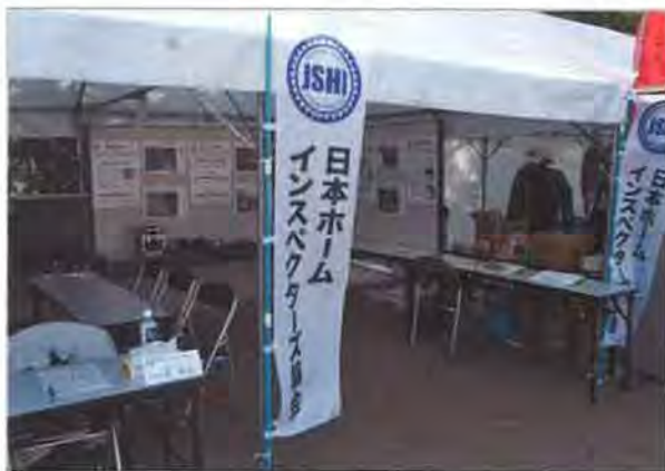
特製の「のぼり」をたてて集客を狙う

ホームインスペクション普及を狙い、地域密着型イベントに出展しました。テントを張った専用ブース内に、瑕疵事象などの事例写真をパネル展示し、常駐した会員による住宅診断相談コーナーも設けました。