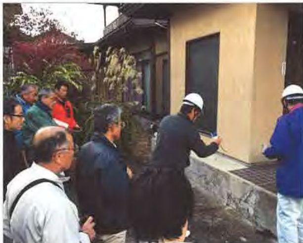
玄関付近のクラック、コンクリートの表面が剥離した状態をJSHI会員が診断中