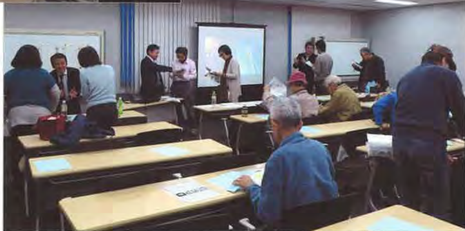
質疑応答終了後も参加者からの相談は続き、運営した近畿エリア部会の会員が丁寧に対応しました