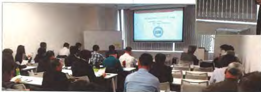
新たに入会した会員を中心に33名が参加しました