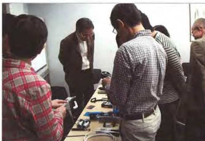
初めて目にする道具類に興味津々の参加者たち