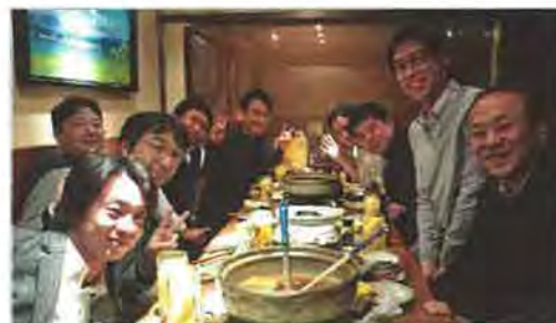
地域を超えた意見交換も活発で、おいに盛り上がりました